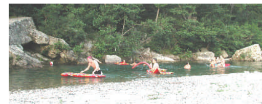
Luft-Matratzen-Tour auf dem Gardon .